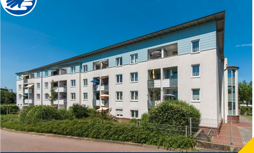
Heidberg | Gerastraße 1