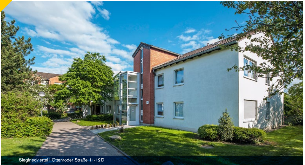
Siegfriedviertel | Ottenroder Straße 11-12D

Das Wohnen in der Anlage „Seniorenwohnen 60+“ ist ausschließlich Menschen ab 60 Jahren vorbehalten. Ein Plus an Sicherheit bietet eine Notrufanlage, mit der jede der 80 Einheiten ausgestattet ist. Fast alle Hauseingänge verfügen über komfortable Plattformlifte, die gerade bei Rollstuhlfahrern beliebt sind.