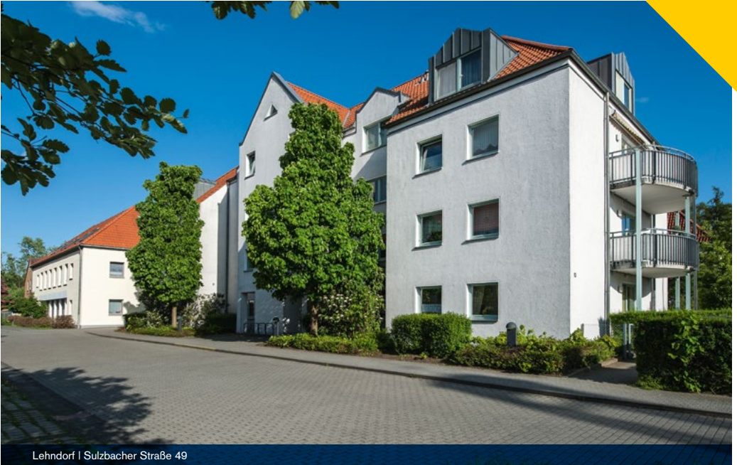
Lehndorf | Sulzbacher Straße 49